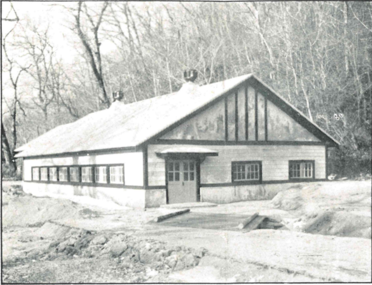
(粒万千一) 室化 解五第 場化 解歳千