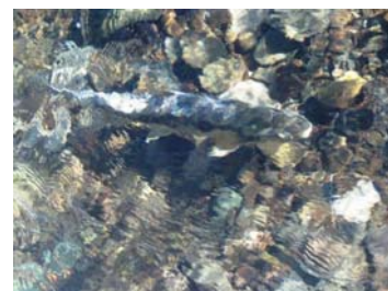
千歳さけます事業所構内にて(2014 年 1 月 15 日)

今号の表紙絵は、真冬の光景ながら穏やかで柔らかなタッチが印象的です。絵本の一頁のようにも見えますが、実は、明治 27 年に発行された「北海道鮭鱒人工孵化事業報告」に綴られた絵で、開設間もない頃の現千歳さけます事業所の様子が描かれています。この事業報告によると、当時の千歳川ではサケの捕獲採卵は 11 月から翌年 2 月に行われていたようです。もしかすると川の左手を行く二人はまさにその作業中なのかもしれません。現在では捕獲採卵は秋を盛期に行われていますが、真冬の千歳川をそ上するサケは今年もその姿を見せてくれています。