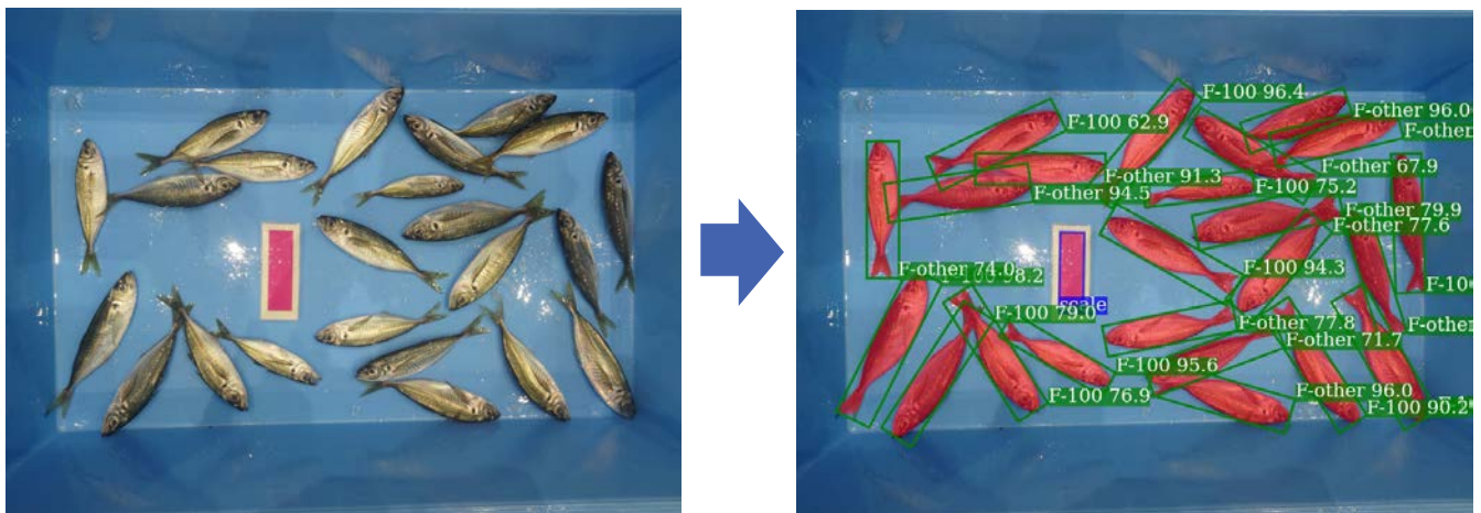
図2 スマホで撮影した画像(左図)をAIによって予測させた結果(右側)の例(マアジ) F-100は重複がない魚で、F-otherは体のどこかが重複で隠れている魚(数字は確率を表す)